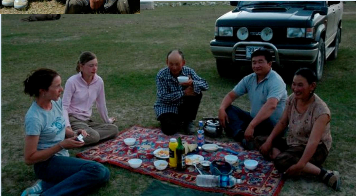
Essen bei einer Nomaden familie