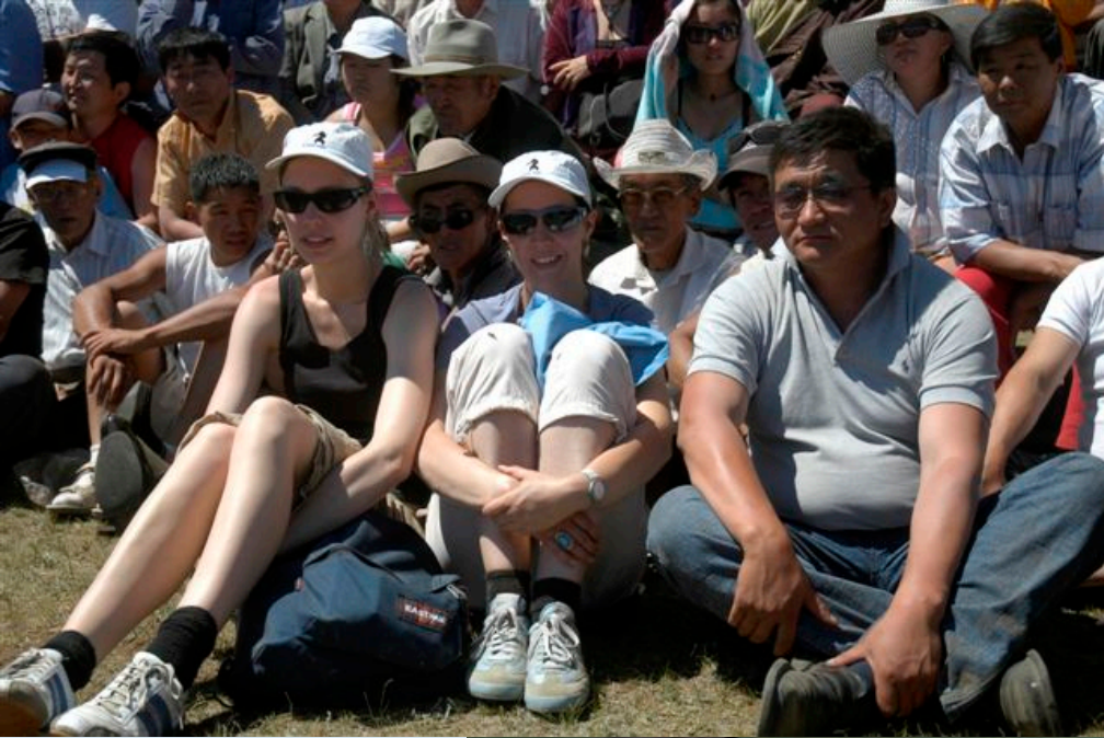
beim Naadam Fest